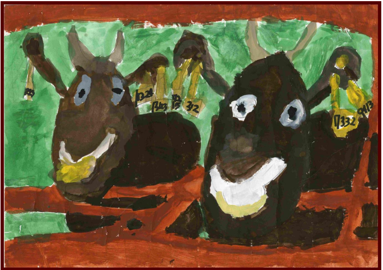
「おうみのうしさんたち」